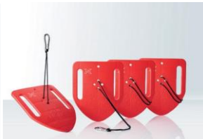
Sandverankerung Für alle Zeltgrößen