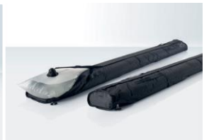
Wandballastierung Für alle Zeltgrößen