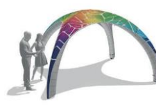
XG 4 | XG 5 XG 6 | XG 8