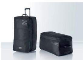
Trolley XL / XXL Für: XC 3; XG 4, 5, 6