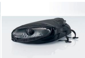
Säulenballastierung Für: XC 3; XG 4, 5, 6