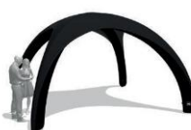
XG 4 | XG 5 XG 6