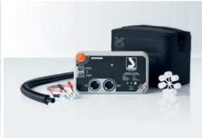
Elektropumpe BRAVO TURBOMAX Für: XC 3; XG 4, 5, 6