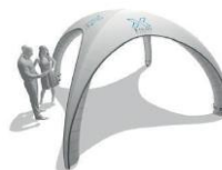
XC 3 | XG 4