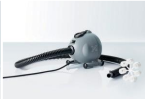
Elektropumpe BRAVOOV10 Für: XG 4, 5, 6