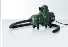
Elektropumpe BRAVO 230/2000 Für: XC 3; XG 8