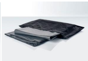
Schutzfolie Für alle Zeltgrößen