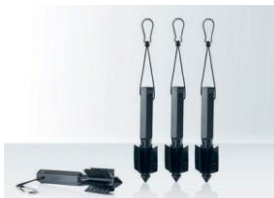
Schneeverankerung Für alle Zeltgrößen