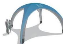
XG 6 | XG 8