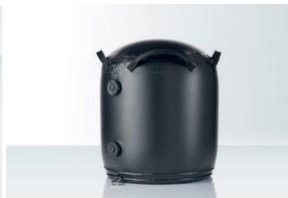
Wasserballastierungstonne Für alle Zeltgrößen