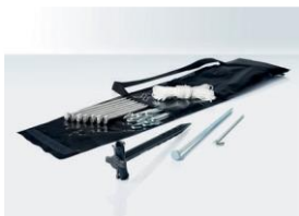
Grasverankerungen Für alle Zeltgrößen