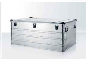
Aluminum Box Für alle Zeltgrößen