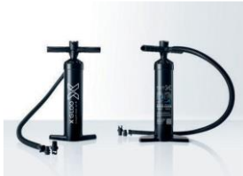
Handpumpe Für: XC 3; XG 4, 5, 6