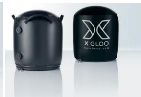
Digital-bedruckter Überzug Für die Wasserballastierungstonne. Auch als Sitz verwendbar.