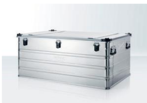
Aluminum Box Für alle Zeltgrößen